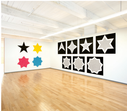
SOL LEWITT Edificio 7, 2do piso