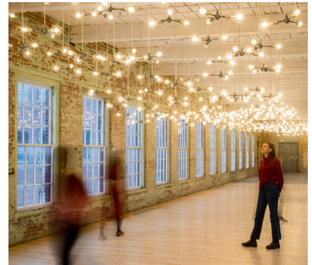
SPENCER FINCH Edificio 8, 2do piso