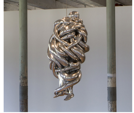
LOUISE BOURGEOIS Edificio 6, 2do piso