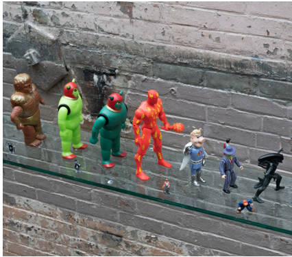
JARVIS ROCKWELL Edificio 6, 2do piso